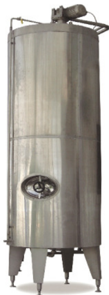
Tank za prijem mleka

За израду танка у потпуности је коришћен материјал стандарда БС304С15. Постоље је израђено од лима дебљине 3мм, коса данца су дебљине 4мм, полирана према стандарду за млекарску индустрију. На унутрашњој посуди се налазе прикључци за утакање млека, одзрачњу, ниво сонду, сонду за мерење температуре, цип, бочни мешачи и ревизиони отвор (манлох).